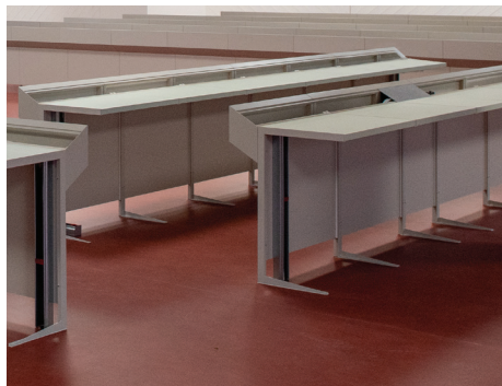
Landratspulte (im Rohzustand)